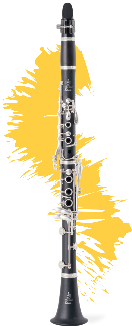
Étude B \flat