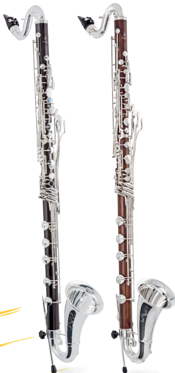
Emperior Bass Clarinet GSP