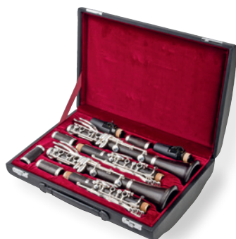
豪华真皮双盒 极悦系列