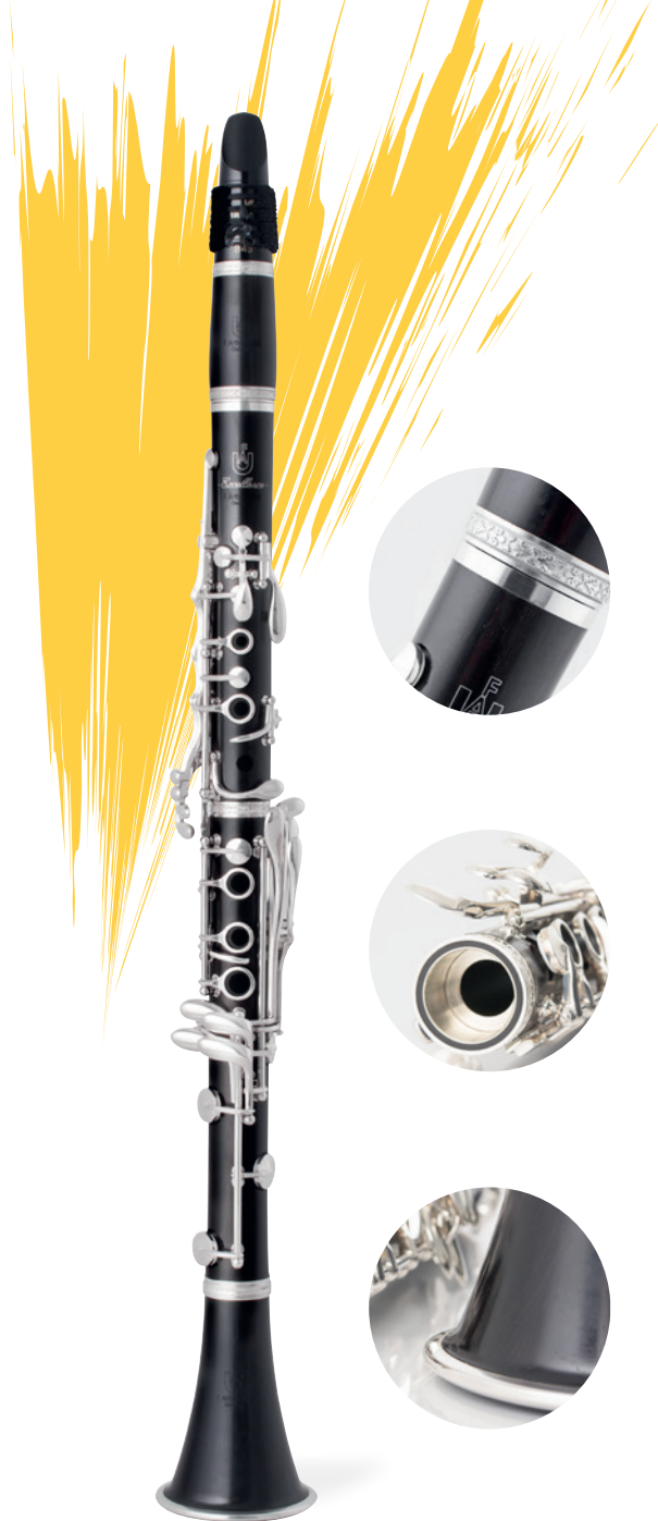
Excellence B \flat

“极致”以其饱满、坚定并宽广的声音而与众不同，在为你呈现丰富色彩可能性的同时保留了其纯正的音色，金属制下节管插口增加了声音的爆发力，并搭配了独特的百合花铸造装饰管体箍，彰显优雅魅力。