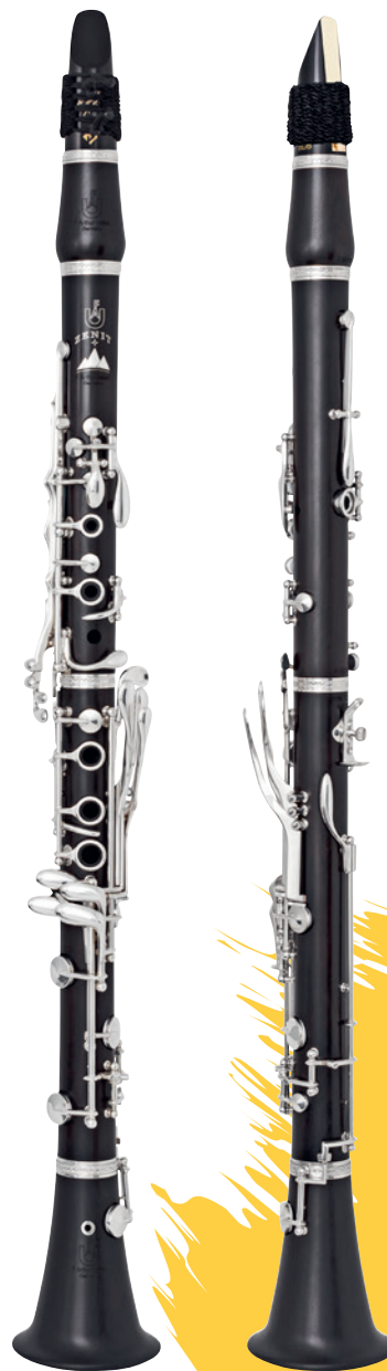
Zenit TC A GSP

受雨博德式单簧管的启发，我们首次在法式单簧管“巅峰-Zenit”系列中加装半自动低音E/F拇指修正键。