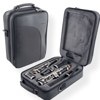
轻型帆布皮革乐器盒 艺途系列*