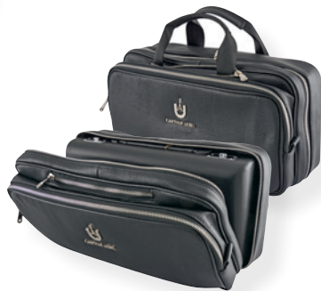
真皮随型乐器盒外装套包