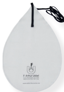
单簧管通管擦拭布 超细纤维