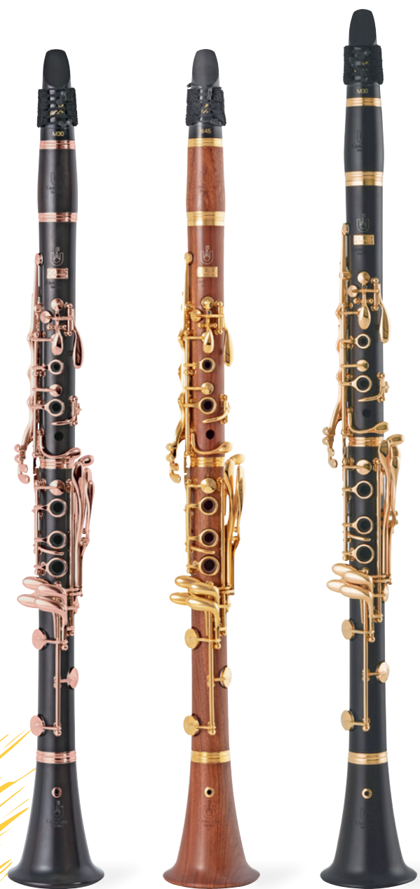
Superior rose gold Superior Mopane 24k Superior 24k