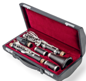
豪华真皮乐器盒 极悦系列