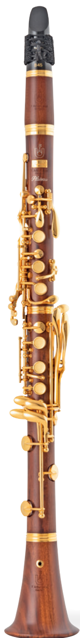
Superior Plateau Bb

25键·全封闭式音孔盖·精选最高品质的 自然风干东非黑黄檀木或可乐豆木·符合人体 工程学设计的按键·内切拔音孔·降E摆动键 “极悦”内膛·喇叭共鸣孔·两个二节·可调式 镀银带圈手托·LP-Gore®镀膜垫·镀银按键 纯银镶嵌商标·弯德林笛头, 哨片, 古典哨卡 豪华真皮乐器盒·真皮配件包