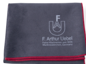
超细纤维按键擦拭布