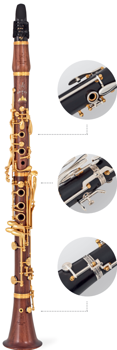
Zenit AC B \flat MGP

致力于提供更精确的十二度泛音音准和更宽广的色彩深度，引领单簧管演奏家们追逐更高的艺术境界。