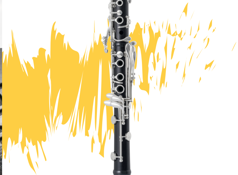
Superior II B \flat