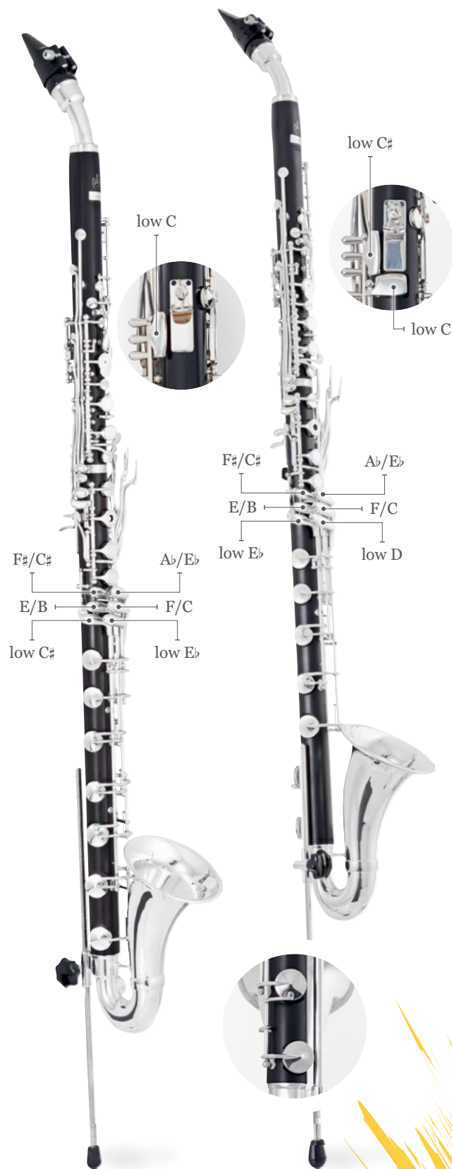
极悦-巴塞特号 进阶型

至低音C · Eb摆动键 · G共鸣键 · Bb共鸣键 两个S弯 · 精选最高品质自然风干东非黑黄檀木或可乐豆木 · 可调式带圈手托 S弯、喇叭与按键镀银 · 纯银镶嵌商标 巴塞特号随型便携背包 · Vandoren笛头， 哨片 · Rovner哨卡