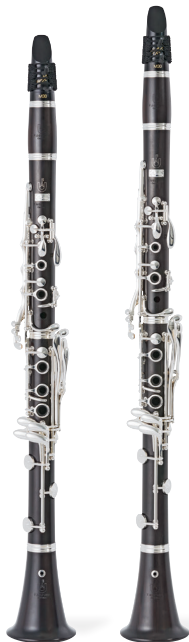
Superior B \flat