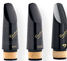
弯德林 笛头 B45, M30, BD5