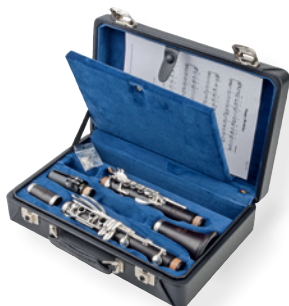
豪华皮革乐器盒 优典 & 优选系列*