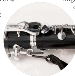
Modell 621 KH